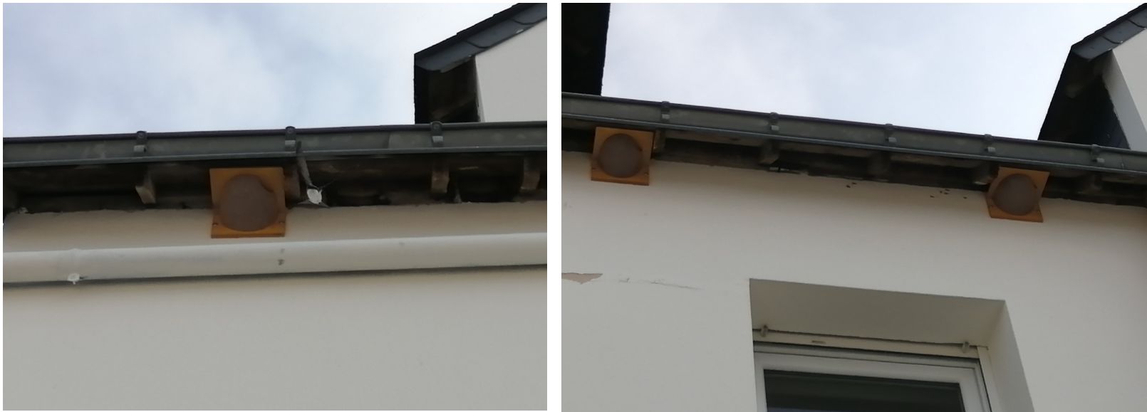
Nids artificiels installés par VGH en avril 2022 dont celui de gauche est déjà occupé

Les travaux ont été réalisés en hiver, il n'y a donc pas eu de destruction d'individus mais il y a bien eu de la destruction de nids. Sur les 14 nids occupés en 2020, 10 ont été détruits et les 4 sur la partie Nord ont donc été préservés. De plus, Vannes Golfe Habitats a disposé en avril 2022 un total de 6 nids artificiels. Lors de notre visite le 29 avril 2022 quatre nids étaient déjà occupés par les Hirondelles de fenêtre : 3 nids naturels et 1 nid artificiel.