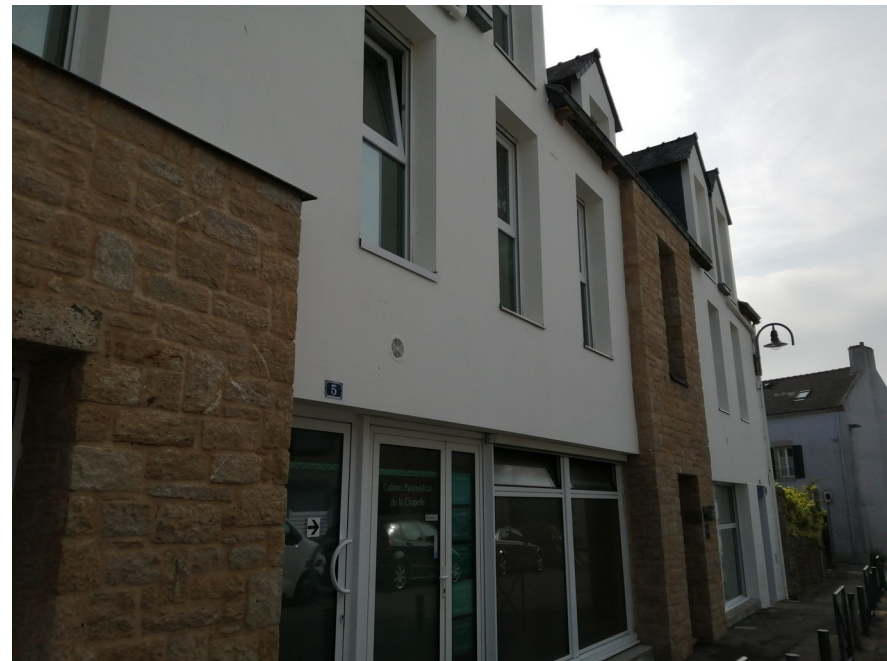
Bâtiments appartenant à VGH rue des anciens combattants (en 2020 à gauche et en 2022 à droite)