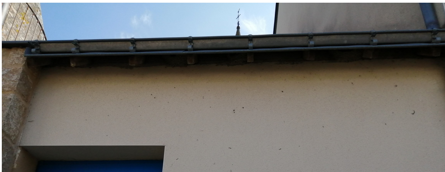
Nids d'Hirondelles de fenêtre sur la résidence en juin 2020